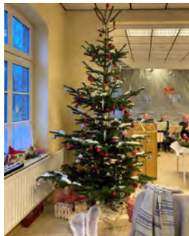
Weihnachtsmarkt Nethen 2022 (hk)

In diesem Jahr feiern wir am 11. Dezember um 14.00 Uhr auf dem Weihnachtsmarkt in Nethen eine Adventsandacht auf Plattdeutsch .