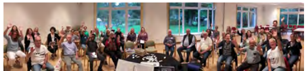
Chorprobe im Gemeindehaus

Wir freuen uns auch zukünftig über Verstärkung in allen Stimmgruppen.