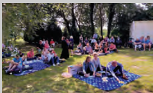
Picknick beim Tauffest 2021 an den Fischteichen in Loy-Barghorn (fh)

Anschließend besteht die Möglichkeit zu einem Picknick.