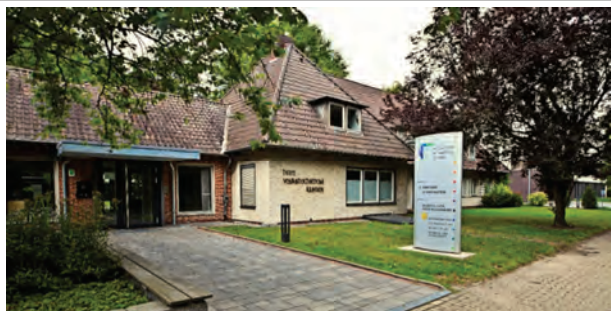
Ev. Bildungshaus Rastede, Mühlenstraße 126 (Ev. HVHS Rastede e.V)