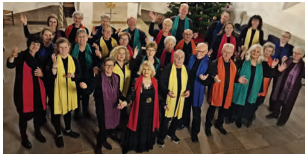
Rastede Gospel Choir 2022